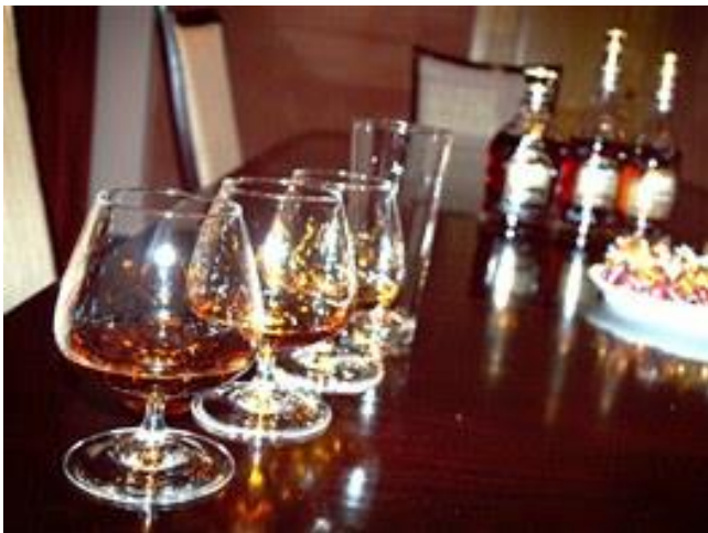
Arménská brandy Ararat

Kenact! Mám dojem, že naše arménština se šíleně zrychluje.