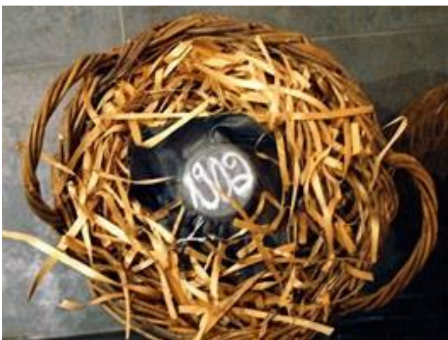
Nádoba s letitou arménskou brandy Ararat