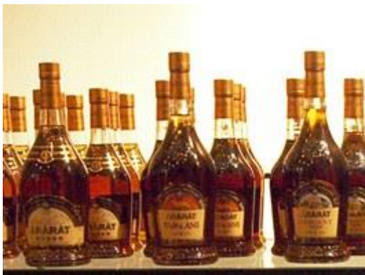
Police s lahvemi arménské brandy Ararat