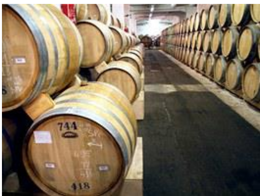
Sklepy jerevanské výroby jsou plné drahocenné lihoviny