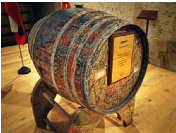
"Mirový sud" ve výrobě brandy Ararat